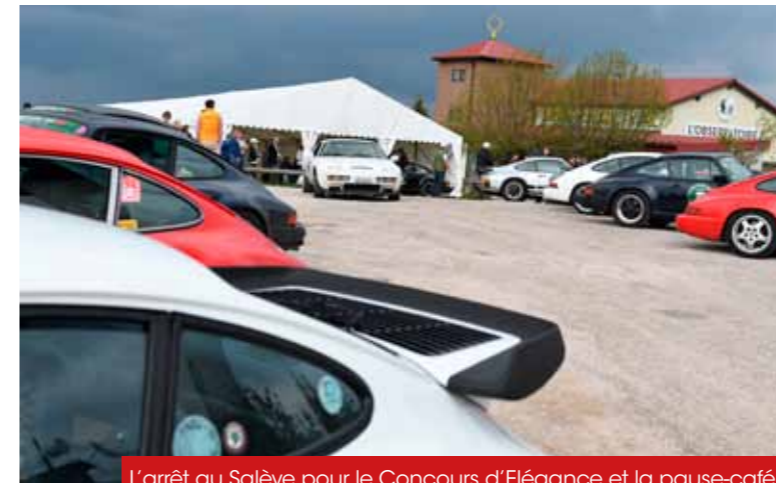
L'arrêt au Salève pour le Concours d'Élégance et la pause-café.