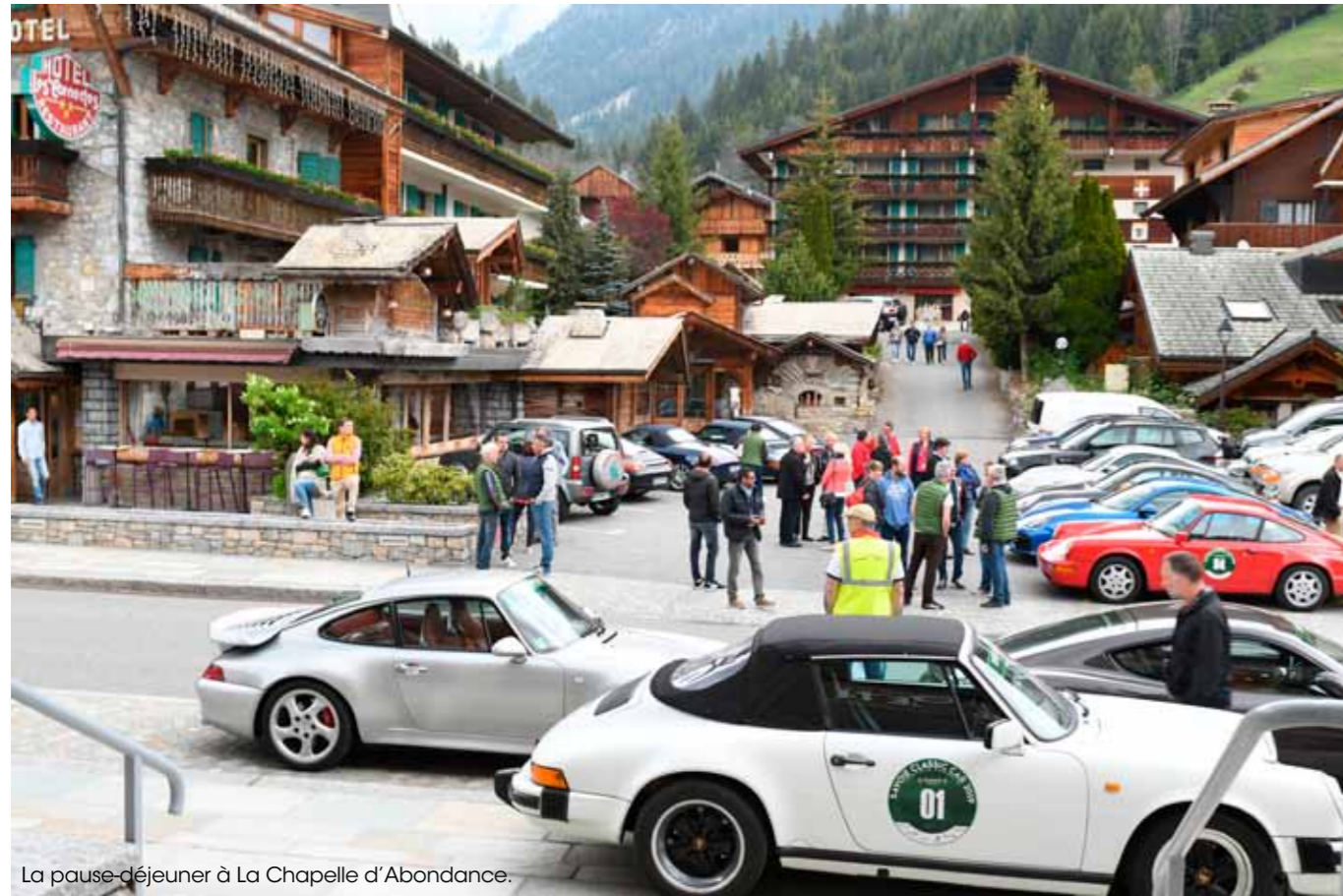
La pause-déjeuner à La Chapelle d'Abondance.