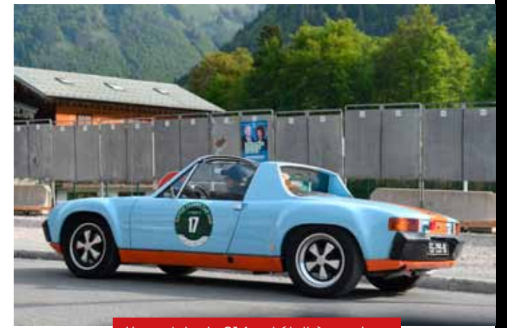
Une originale 914 qui était à vendre..