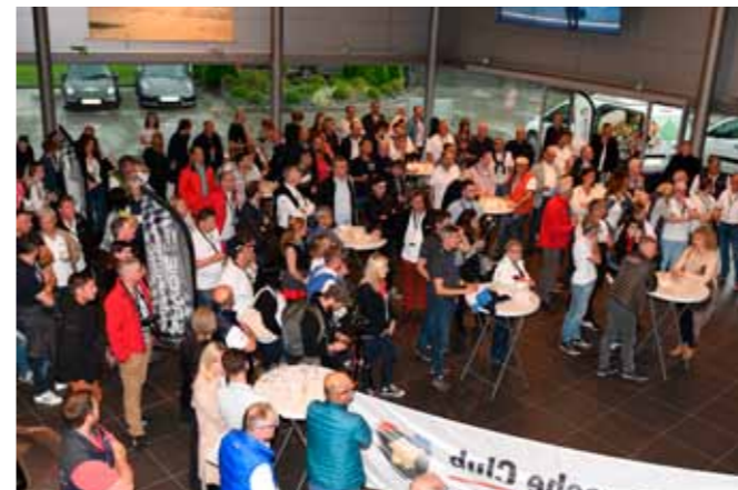
La traditionnelle remise des prix au Centre Porsche Annecy.