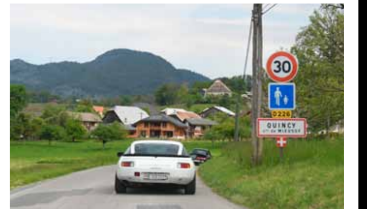
Une seule 928 S parmi les concurrents cette année.