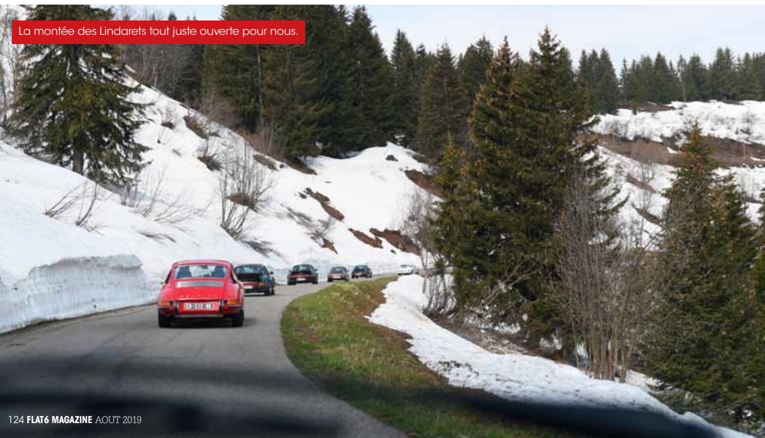
La montée des Lindarets tout juste ouverte pour nous.