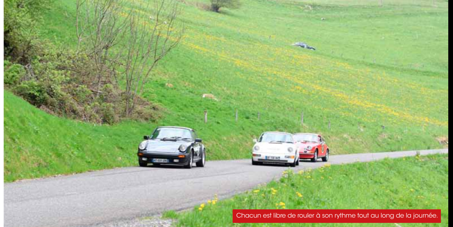
Chacun est libre de rouler à son rythme tout au long de la journée.