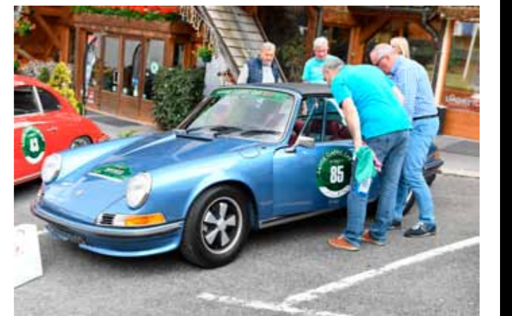
Une 911 S 2.4L Targa trappe à huile Bleu Gemini de 1972 très joliment restaurée.