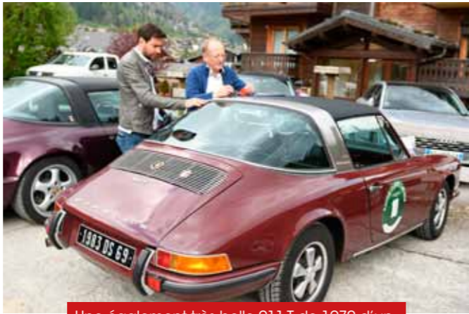
Une également très belle 911 T de 1970 d'un membre du Club Porsche Rhône-Alpes.