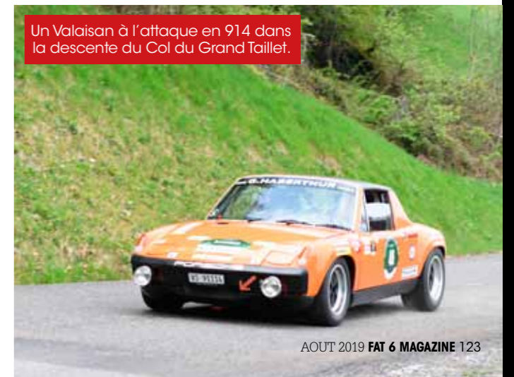
Un Valaisan à l'attaque en 914 dans la descente du Col du Grand Taillet.