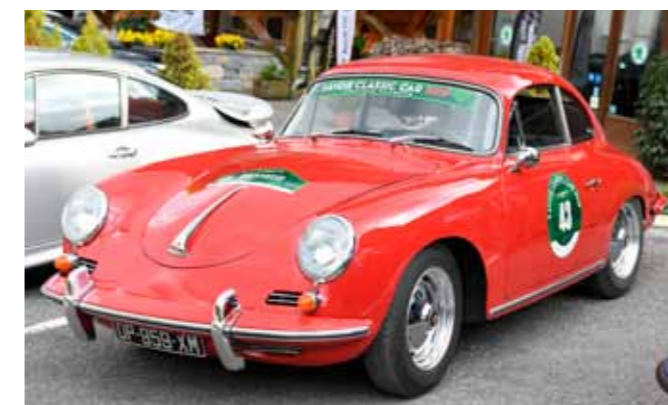
Une belle 356 BT5 1600 Super de 1960 restaurée et équipée d'un moteur 90 cv.