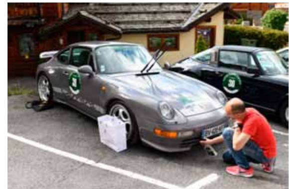
Cette 993 à la couleur Porsche Exclusive a gagné le Concours d'Élégance..