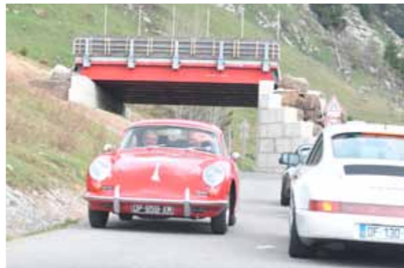
Pas toujours facile de bien suivre le Road Book !