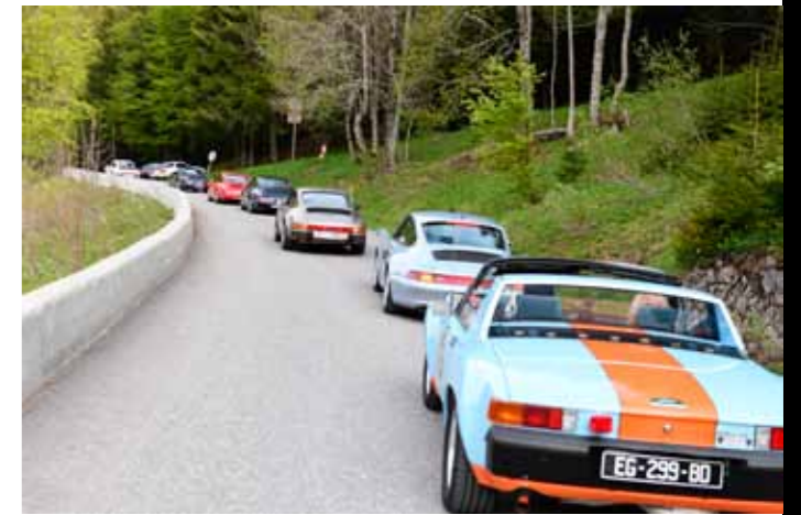
Embouteillage dans la montée des Lindarets.

Une petite parenthèse pour dire combien la conduite de ces oldtimers est gratifiante et enivrante. La sensation de faire corps avec sa voiture, de pouvoir vraiment la piloter et en tirer toute la quintessence sans assistance ou presque sur nos belles petites routes de la région est tout simplement unique. Sans parler du son du flat six et des odeurs qu'on ne retrouve plus dans les modernes refroidies à eau. Pour avoir fait une sortie du Club quinze jours auparavant au volant d'un cabriolet Carrera GTS de dernière génération, j'ai pu vraiment voir la différence et constater l'évolution des vé-