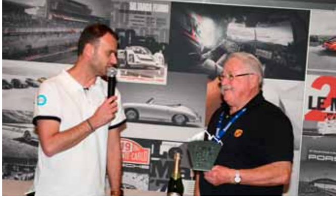
Un prix spécial pour le concurrent venu de plus loin.